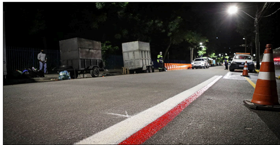
Equipamento conecta as ruas Padre Roma, do Rosarinho e Amélia e tem 1km de extensão

“A gente está implementando mais uma ciclofaixa na cidade. Com essa nova ciclofaixa, a gente consegue conectar 72 quilômetros da malha cicloviária, integrar toda a Zona Norte do Recife com a parte Central. Agora vai ser possível sair de bicicleta da Estrada do Arraial, Estrada do Encanamento, e conseguir chegar até o Centro do Recife”, explicou João Campos. “A gente tem o compromisso de fazer 100 quilômetros, pelo menos, de ciclofaixa nos próximos quatro anos e a gente já está começando. Já entregamos 10 quilômetros para a malha cicloviária e ainda vamos fazer muito mais”, garantiu.