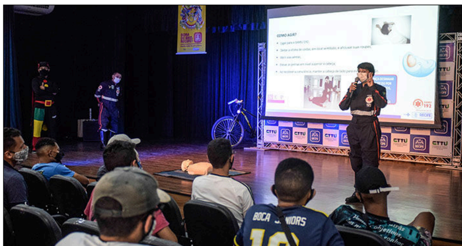
Ação envolveu CTTU, Compaz, Samu Recife, Iniciativa Bloomberg, iFood e Abraciclo

Com o objetivo de garantir a segurança viária dos ciclistas, a Prefeitura do Recife, por meio da Secretaria de Política Urbana e Licenciamento (Sepul) e da Autarquia de Trânsito e Transporte Urbano (CTTU), pro-