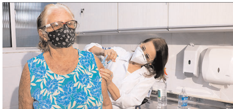
Até o final deste mês, equipes da Sesau imunizarão população em diversos pontos da cidade

A Prefeitura do Recife começou a intensificar as ações de vacinação contra a gripe, ontem, montando pontos itinerantes em diversas áreas da cidade, com o objetivo de aumentar a proteção dos moradores da capital contra a doença. A estratégia está dentro da Campanha Nacional contra Influenza, e contempla a população geral, utilizando as cerca de 200 mil doses remanescentes. Na ação, a Secretaria de Saúde do Recife (Sesau) também vai disponibilizar a vacina tríplice viral para aqueles que nunca tomaram o imu-