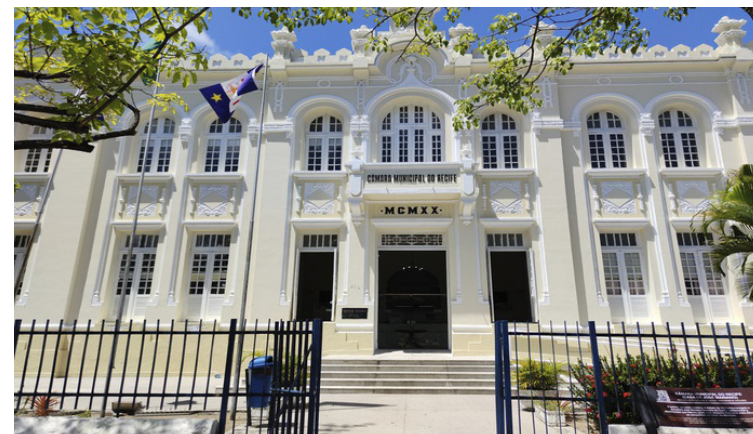
Parlamentares aprovaram quatro emendas ao projeto de lei do Executivo